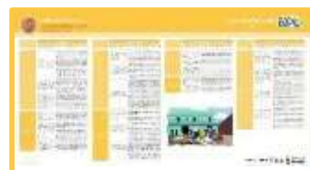
Matrices de referencia