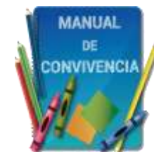
Manual de convivencia