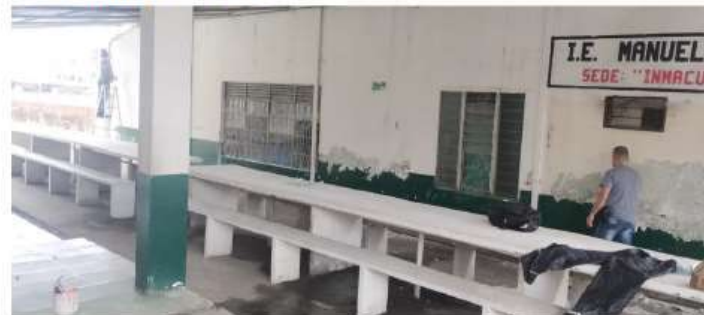
ARREGLO DE PAREDES COMEDOR RESANE ESTUCO Y PINTURA DE AGUA Y D ACEITE COLOR BEIGE Y VERDE