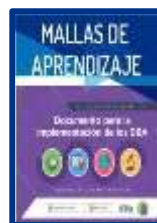
Mallas de aprendizaje