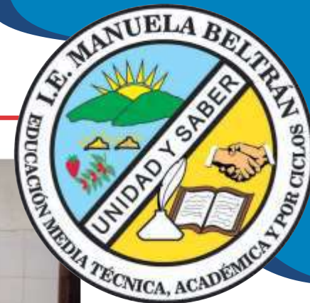
SEDE INMACULADA CONCEPCION

Enchape del mesón de la cocina, adecuación de paredes (humedad, estuco y pintura de aceite) Organización de letreros